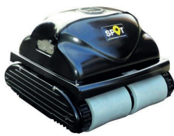
Spot PRO 20

Ultrakevyt allasrobotti pieniin altaisiin.