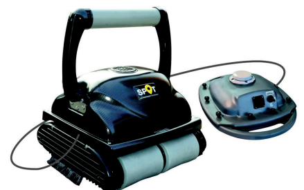
Spot PRO 150 XD