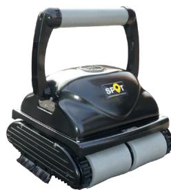
Spot PRO 100